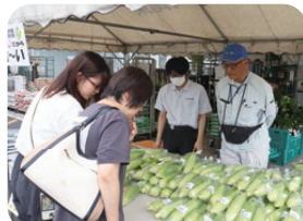
スイートコーンの対面販売