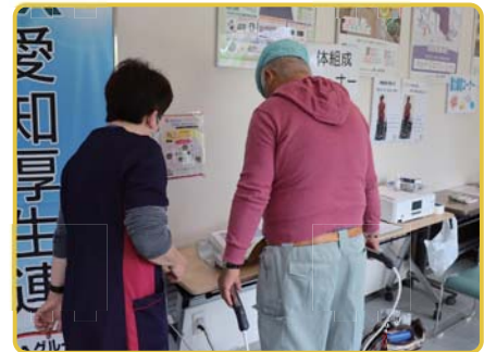
まちかど健康チェック

組合員とのつながり強化を目的として、7月に組合員および組合員家族に対し瀬戸・東郷地域にて「健康診断(集団人間ドック)」を実施しました。8月には組合員および組合員家族に対し健康講話やウォーキング講座等をセットにした健康教室を開催します。