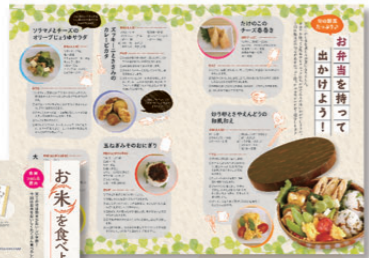
旬の野菜たっぷり♪ お弁当を持って出かけよう！ (R3.5月号)

毎月連載している食育キッチンに加 え、旬な農産物を使ったレシピ特集を 掲載しました。