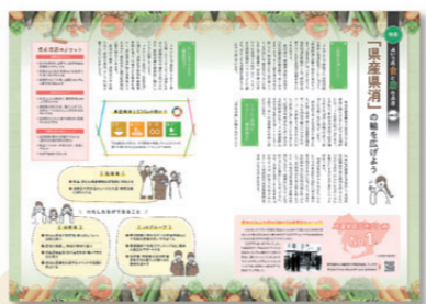
あいちの食と農と未来 (R4.2月号、R4.3月号、R4.5月号)