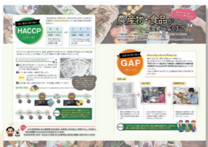
食の安全・安心について考えよう！ 農産物・食品が食卓に届くまで(R3.6月号)

JAの産直施設に並ぶ農産物や食 品を食卓にお届けするため、GAP基 準を設け、生産者・JAが行う安全管 理について解説しました。