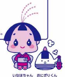
いなちゃん おにぎりくん